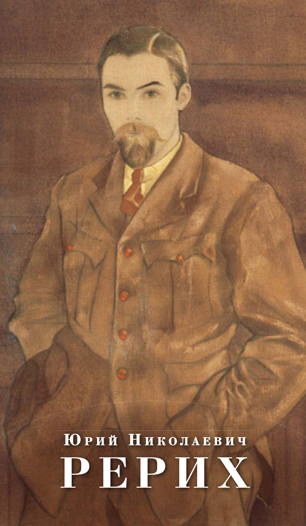
ЮРИЙ НИКОЛАЕВИЧ РЕРИХ