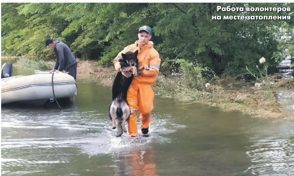
Работа волонтеров на месте затопления