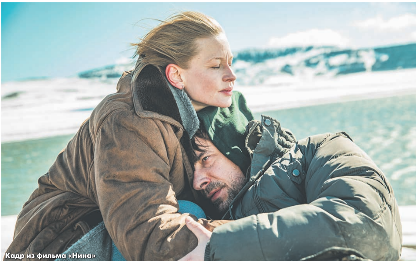
Кадр из фильма «Нина»

НА ШАНХАЙСКОМ КИНОФЕСТИВАЛЕ МИРОВАЯ ПРЕМЬЕРА ФИЛЬМА ОКСАНЫ БЫЧКОВОЙ С ПЕРЕСИЛЬД И ЦЫГАНОВЫМ