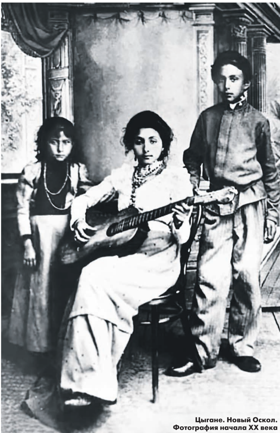
Цыгане. Новый Оскол. Фотография начала XX века