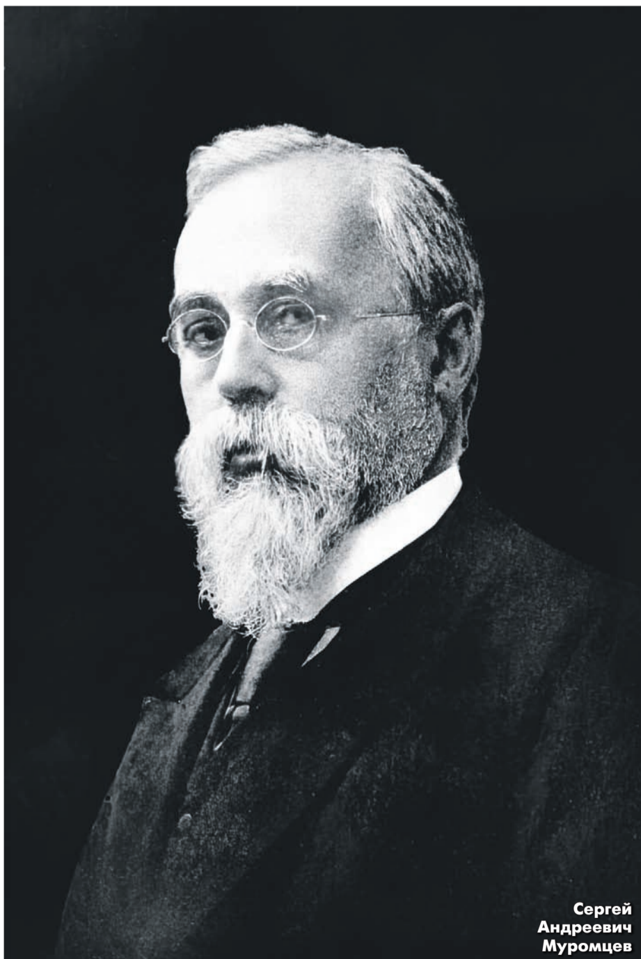
Сергей Андреевич Муромцев

ПРОФЕССОР МУРОМЦЕВ. НИ ОДНА НАДЕЖДА ПЕРВОГО ПРЕДСЕДАТЕЛЯ ГОСУДАРСТВЕННОЙ ДУМЫ НЕ СБЫЛАСЬ