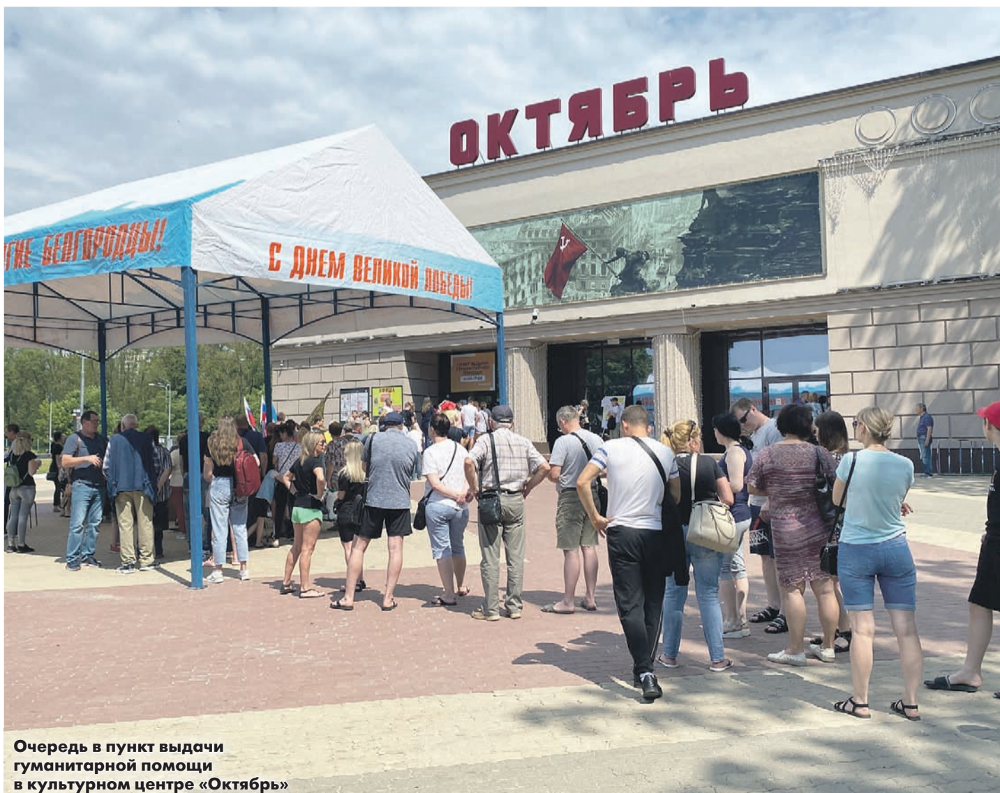
Очередь в пункт выдачи гуманитарной помощи в культурном центре «Октябрь»

Татьяна ВАСИЛЬЧУК, «Новая» Белгород