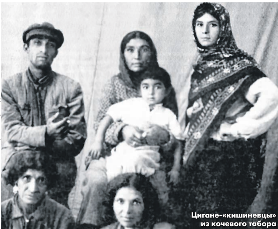
Цыгане-«кишиневцы» из кочевого табора