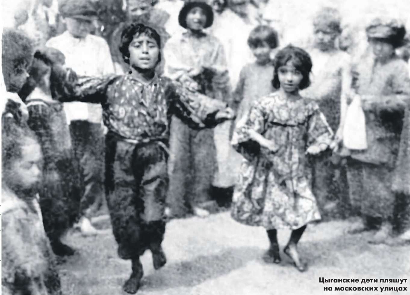
Репортажная фотография 1925 г.

Если в 1926 году, по данным переписи населения, в стране было зафиксировано около 61 тыс. цыган, то в 1937 году их оказалось... абсурдных 2,2 тысячи. Даже учитывая «особенности сталинской национальной политики», думаю, разница больше связана с самим образом жизни цыган, позволившим им переписи избежать. Впрочем, все результаты, полученные в 1937 году, власти назвали