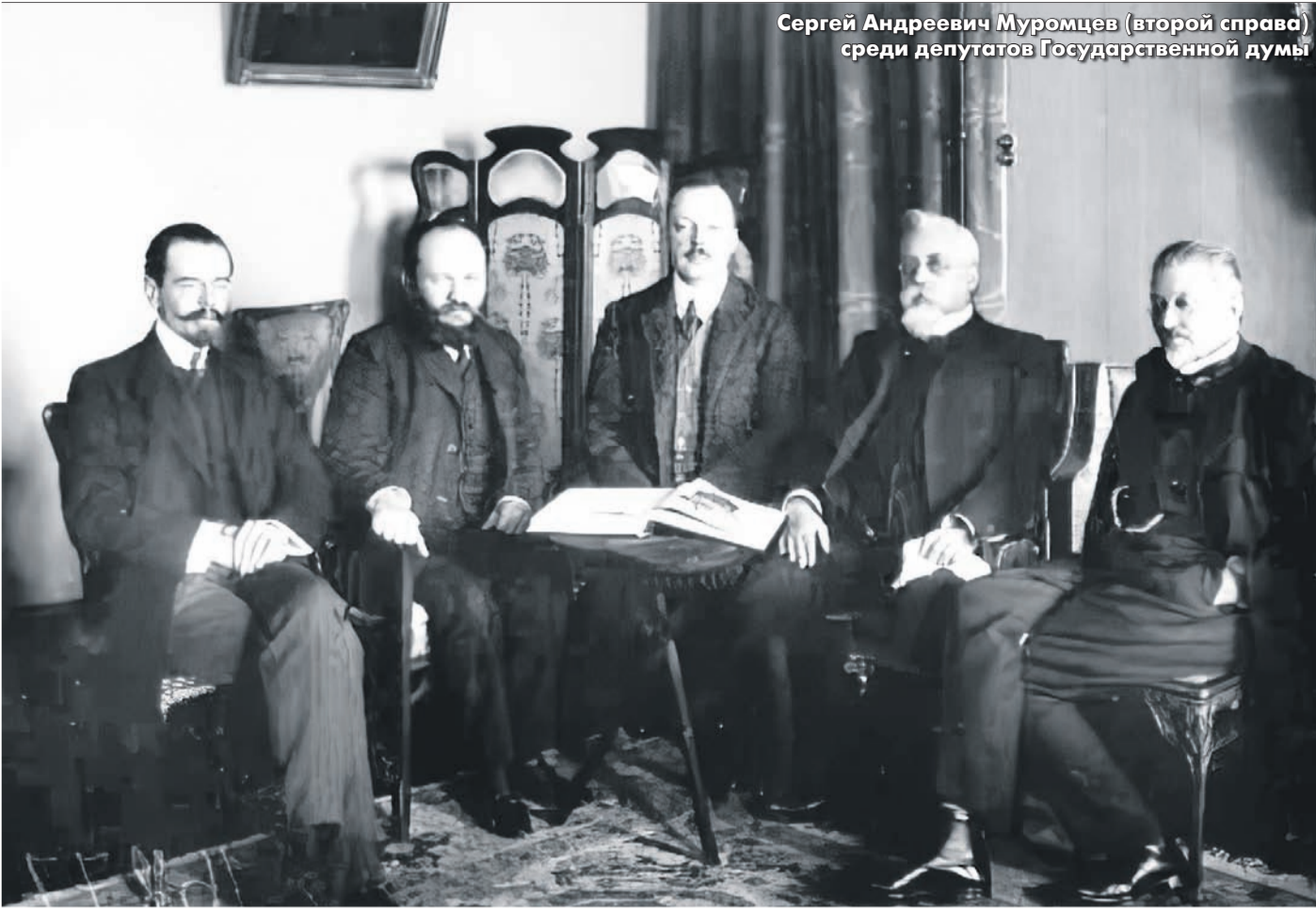
Сергей Андреевич Муромцев (второй справа) среди депутатов Государственной думы