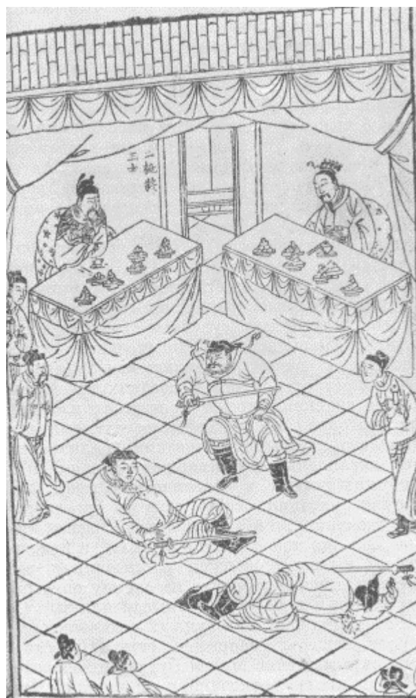
Иллюстрации из книги Фэн Мэн-луна «Цзин ши...»