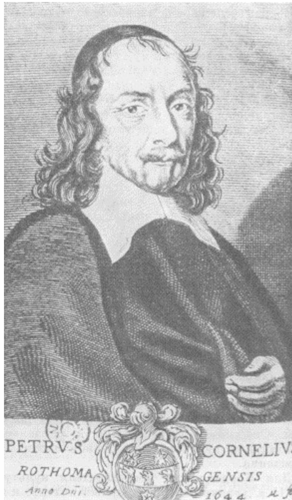
Портрет Пьера Корнеля