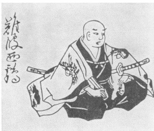
Ихара Сайкаку. Автопортрет

Пародийное переосмысление в книге Сайкаку традиционных притчей о добродетельных сыновьях не было и не могло быть ориентировано на сатирический эффект. Принцип почитания родителей в эпоху Сайкаку был краеугольным камнем всей системы воспитания. (По свидетельству японского ученого К. Нома, сёгун Токугава Цунаёси, узнав в 1682 г. об исключительной сыновней преданности некоего крестьянского сына, приказал выдать ему награду и велел своему советнику, конфуцианцу Хаяси Нобуцу, составить жизнеописание этого достойного сына.) Человек своего времени, Сайкаку не мог решиться на прямое осмеяние столь чтимой в обществе добродетели. Однако сам факт отказа писателя следовать трафаретному принципу прославления благочестивых детей казался достаточно кощунственным. Не случайно при повторном издании сборника в 1709 г. он был переименован в «Новые повести о карме» («Син инга моногатари»).