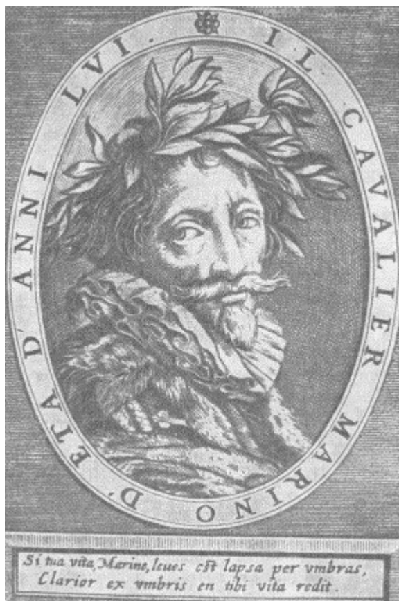
Портрет Джамбаттисты Марино