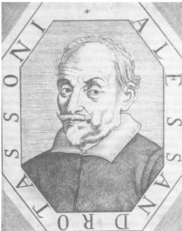
Портрет Алессандро Тассони

Другим комическим поэтом был Франческо Браччолини (1566—1645). В его незаконченной бурлескной поэме «Гнев богов» много выдумки, остроумия и забавных эпизодов, но нет единства замысла, остроты и тенденциозности Тассони. Браччолини тоже осмеивает назойливые возвращения к избитым мифологическим сюжетам и увлечениям классическими формами, обнаруживая изобретательность и владение искусством комической дегероизации, но мишени, по которым он бьет, — уже пройденный литературный этап.