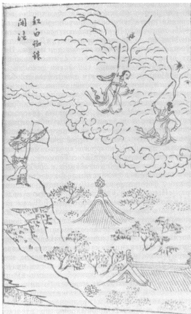
Иллюстрация из книги Фэн Мэн-луна «Син ши хэн янь»

бытового уровня. О мальчике говорили разное. Одни утверждали, что он встретил за деревней двух даосов, которые научили его хитроумным ходам и раскрыли волшебную тайну игры. Но иные, слишком острые на язык, ничему не хотели верить. «Вся эта история — сплошная выдумка, — твердили они. — Просто-напросто у Го-нэна особый талант, и к тому же он беспрерывно, без усталости упражняется в своем искусстве. А рассказы про даосов и духов, которых он якобы видел, годны только на то, чтобы дурачить глупцов». Этот рационализм автора повести, конечно, мог быть навеян конфуцианской идеологией, но пробивающееся здесь новое отношение к герою как к творцу собственной судьбы и своего счастья особенно важно, оно соседствует в повести с вводными стихами о предопределенности событий в духе кармы, однако мотив предопределения здесь явно ослаблен по сравнению с другими повестями.