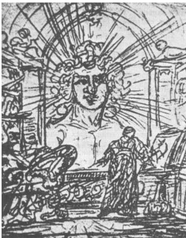
И. В. Гете. Фауст. Появление духа земли