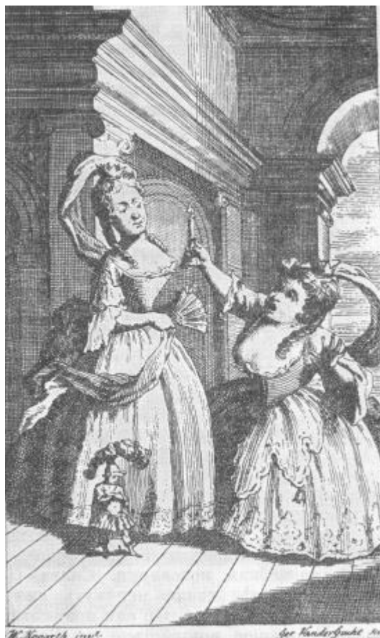
Г. Филдинг. Трагедия трагедий

Гравюра М. Вандергюхта по композиции У. Хогарта