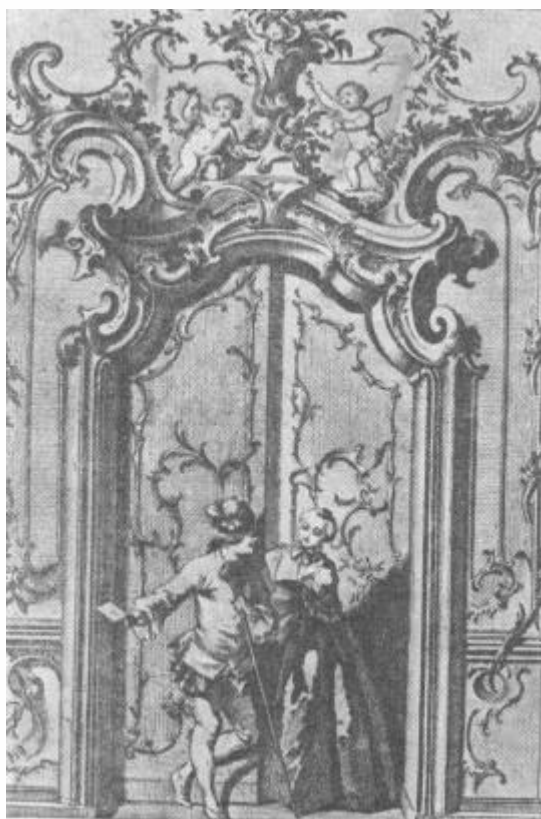
И. Э. Нильсон. Двери салона