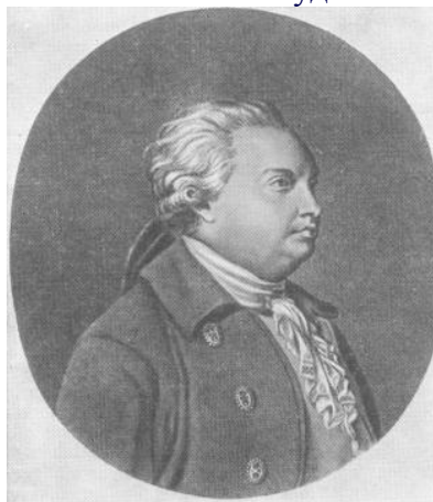
Д. И. Фонвизин