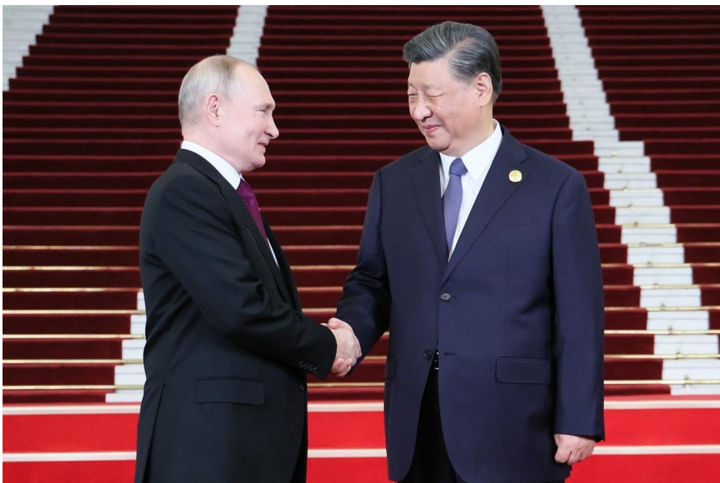
Пекин. Президент РФ Владимир Путин и председатель КНР Си Цзиньпин.

Си обнимает Путина в Пекине, он таким образом душист будущее России как цивилизации в своих объятиях.