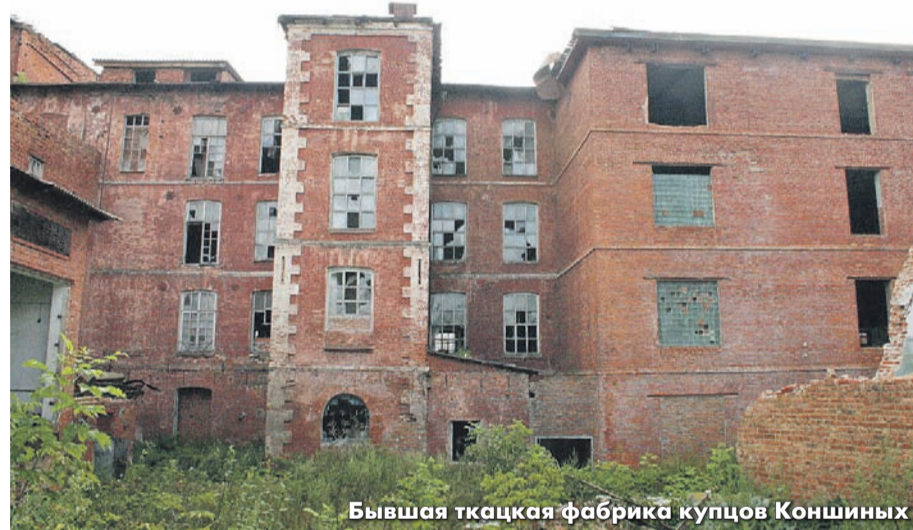
Бывшая ткацкая фабрика купцов Коншиных

А вот зачем объединенному округу статус наукограда, понятно. Наукоград имеют право на получение денег напрямую из федерального бюджета, причем как на цели науки, так и на развитие