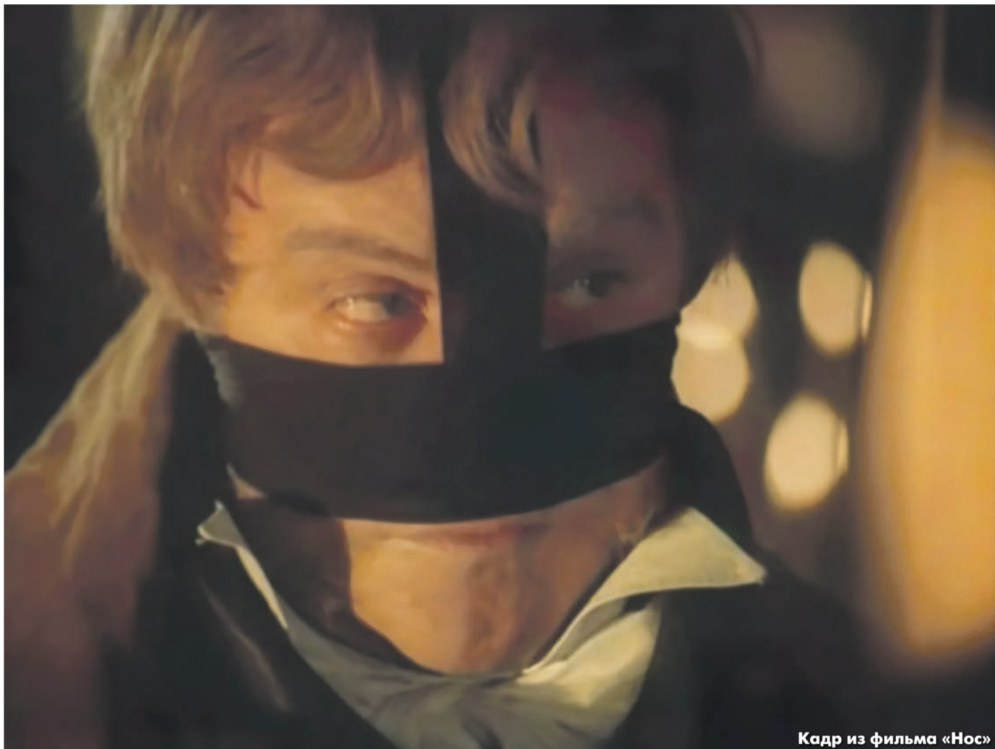
Кадр из фильма «Нос»

«НОС» РОЛАНА БЫКОВА И ФИЛЬМ «МАСТЕР И МАРГАРИТА» МИХАИЛА ЛОКШИНА