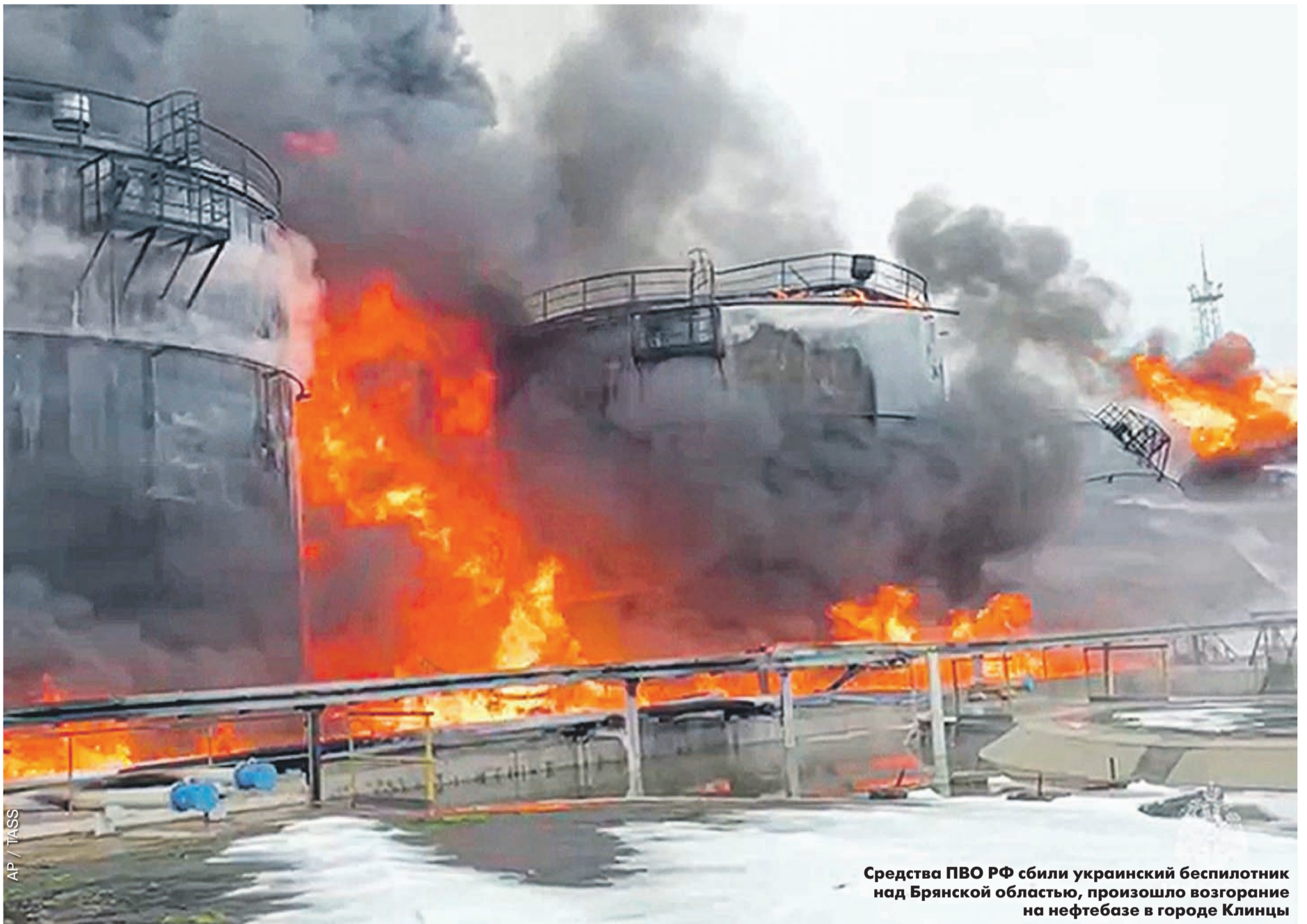
Средства ПВО РФ сбили украинский беспилотник над Брянской областью, произошло возгорание на нефтебазе в городе Клинцы

ПОЧЕМУ ОБЛОМКИ БЕСПИЛОТНИКОВ И РАКЕТ ПАДАЮТ НА ЖИЛЫЕ КВАРТАЛЫ, ЭКСЦЕССЫ ИСПОЛНИТЕЛЕЙ И ПРОПАГАНДА