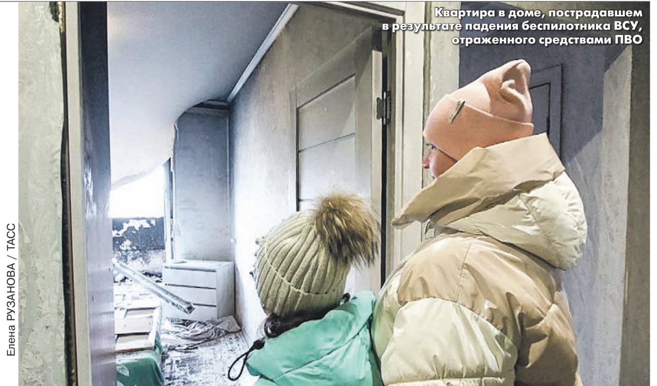
Квартира в доме, пострадавшем в результате падения беспилотника ВСУ, отраженного средствами ПВО

Ракеты обоих комплексов имеют гарантийный срок 10 лет. То есть всем советским ракетам украинского ПВО многократно продлили сроки использования силами комиссий из украинских специалистов — не заводов-изготовителей. В результате соцсети заполне-