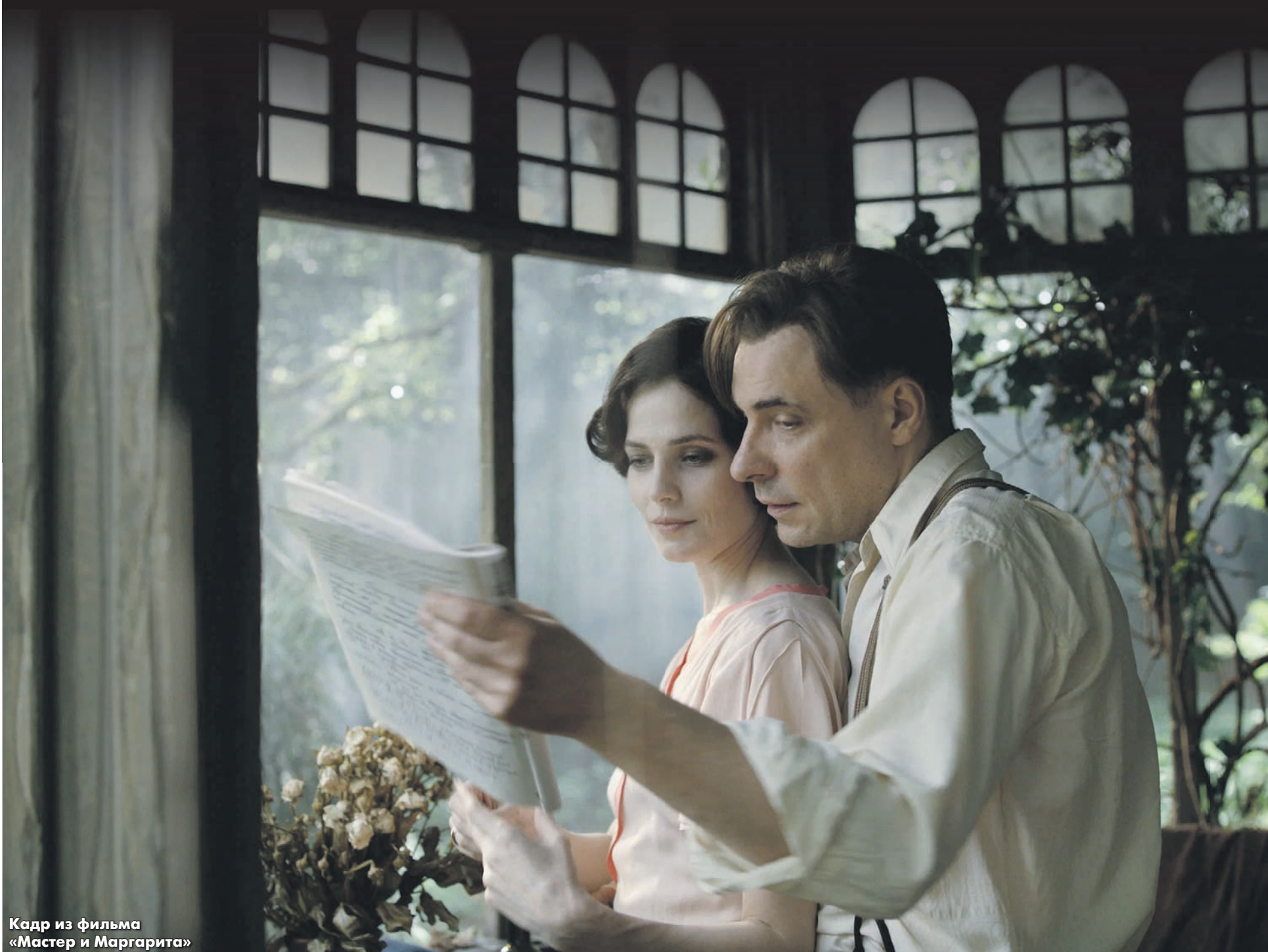
Кадр из фильма «Мастер и Маргарита»

Картина по мотивам легендарного романа-мифа «Мастер и Маргарита» со всей булгаковской метелью вышла за пределы экрана. И теперь метет по всем пределам: соцсетей, телеграм-каналов, грозных инстанций и департаментов. Мчатся наперегонки: зрители — в кинотеатры, чтобы успеть увидеть; и циклопических размеров армия ультра-патриотов, не видевших картину, — с донесениями в разнообразные органы (от СК до «Госуслуг»), чтобы запретить тлетворный «продукт» враждебного режиссера.