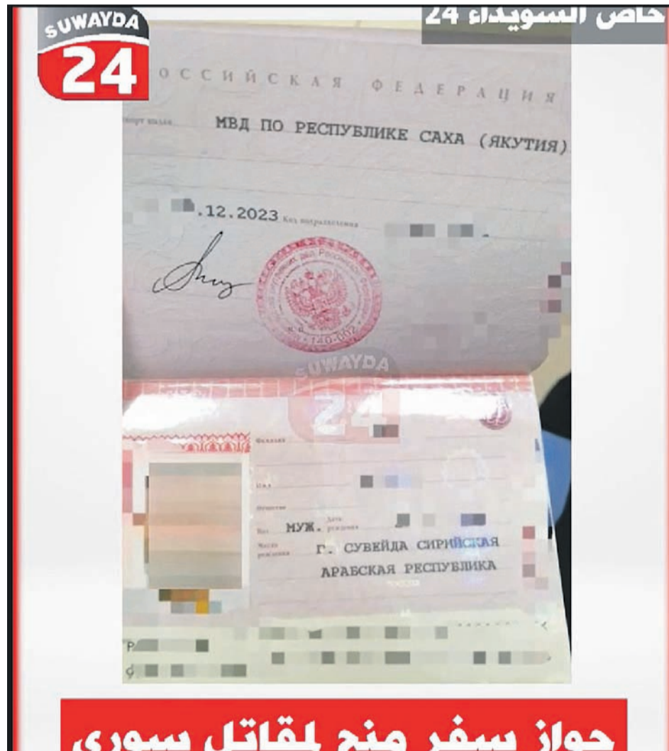
Российский паспорт, полученный сирийцем в Якутии. Кадр из видео