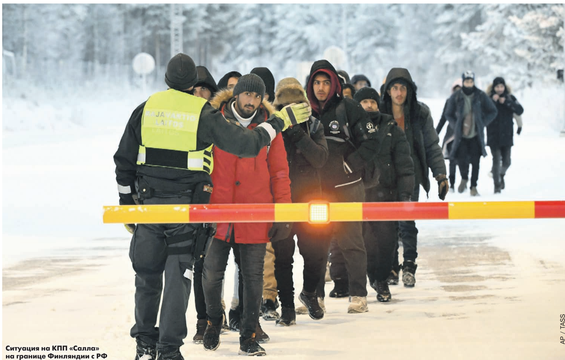
Ситуация на КПП «Салла» на границе Финляндии с РФ

«НОВАЯ» ВЫЯСНИЛА, КАК УСТРОЕН ТРАНЗИТ АРАБОВ И АФРИКАНЦЕВ В РОССИЮ