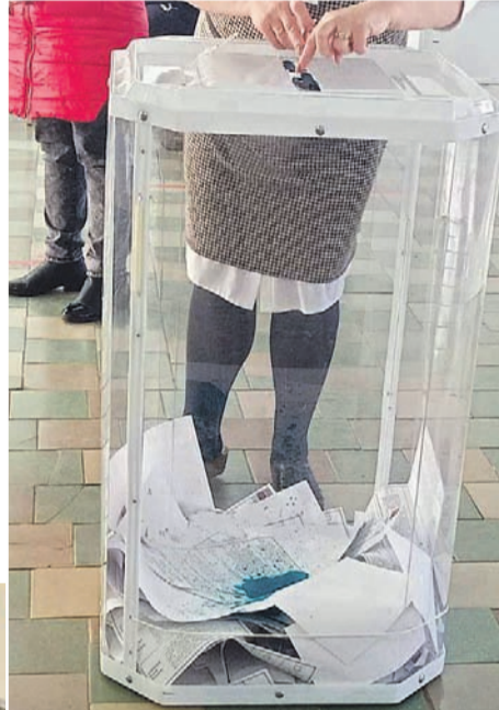
Бюллетени, испачканные зеленкой

лания подводить руководителя и свою организацию, за лишний отгул или еще более укороченный короткий день — но выполняли. А другая часть в это время обрушивала порталы электронного голосования, потому что им сказали зарегистрироваться, привести еще три-пять, в зависимости от организации или города, знакомых, сдать персональные данные и телефоны — и голосовать. Не важно даже за кого. Но с той же мотивацией, что голосовали в аналоговых очередях: отгулы, страх подвести кого-то или потерять премию, нежелание высовываться и идти наперекор.