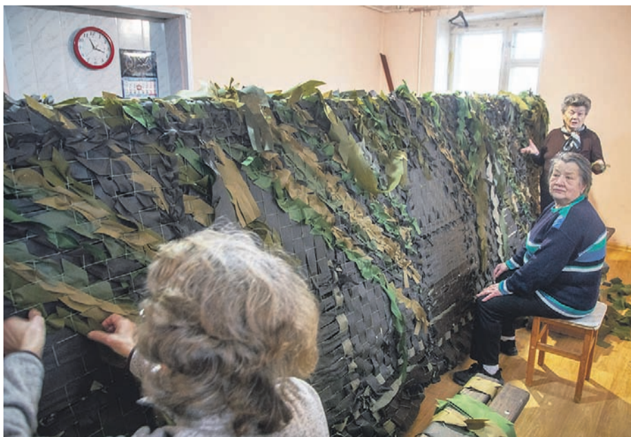
Пошив маскировочных сетей для российских бойцов в зоне СВО

Большинство преступлений здесь — от бедности и нужды: грабежи, разбои, кражи. Доходит до курьезов. Несколько лет назад, после реконструкции поселкового кинотеатра, рядом установили скульптуру — Вицин, Моргунов и Никулин (Трус, Бывалый и Балбес). Но в первую же ночь украли Никулина. Кто-то решил, что скульптура из цветного металла, а оказалось это — краше-