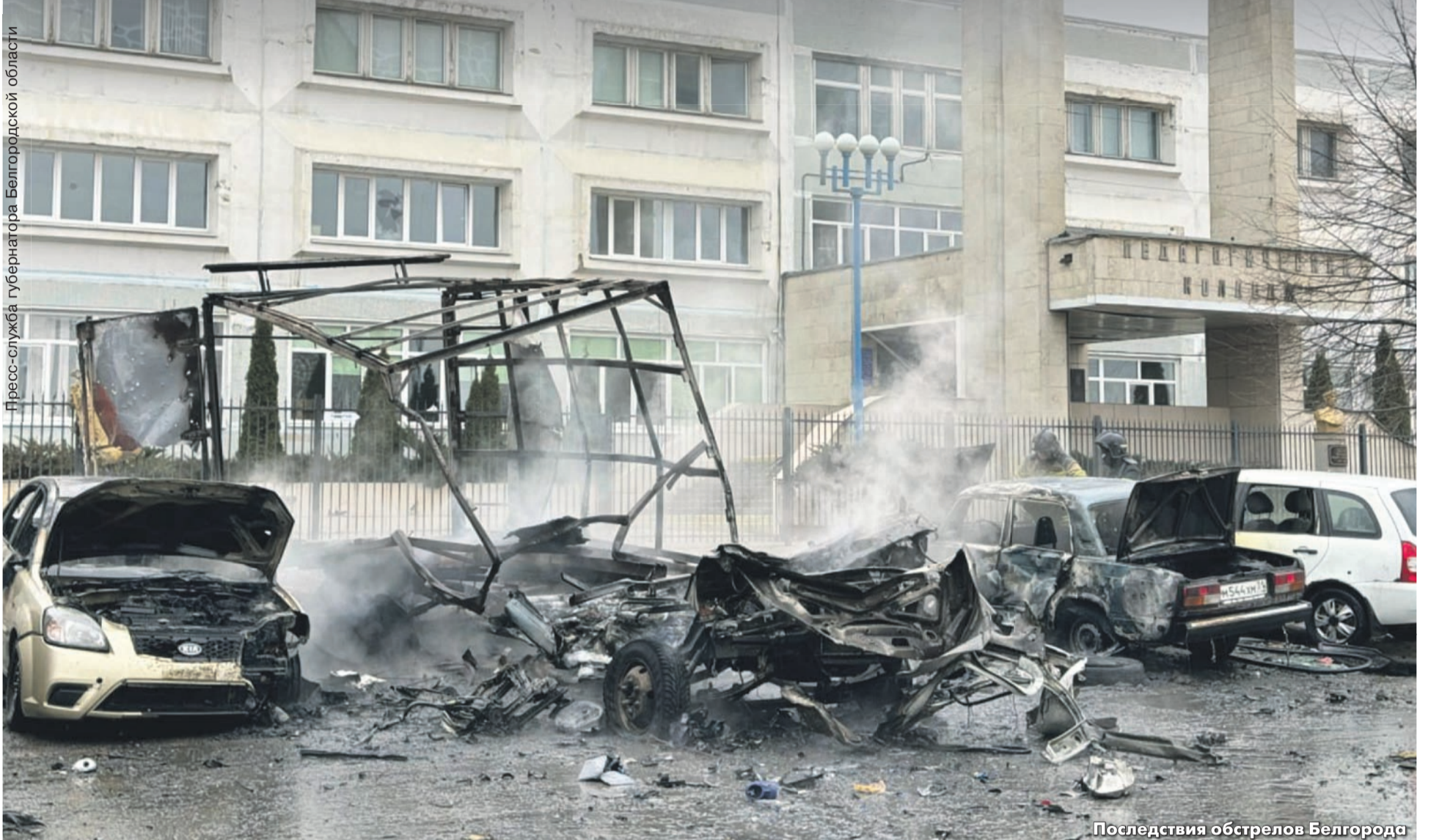
Последствия обстрелов Белгорода