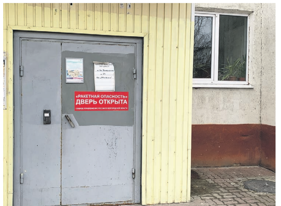
Двери подъездов открываются во время ракетной опасности

P.S. В 11.59 в воскресенье крупный «патриотический» Telegram-канал, предупреждающий об обстрелах, опубликовал сообщение: «Белгород и окрестности — в укрытие». Сирена не выла, выстрелы не звучали, и в общем-то было понятно, что это сообщение скорее связано с намеченной на 12.00 оппозиционной акцией. Но ни в 12, ни в 13 часов на избирательных участках на Гражданском проспекте, который я исходил вдоль и поперек, людей не появи-