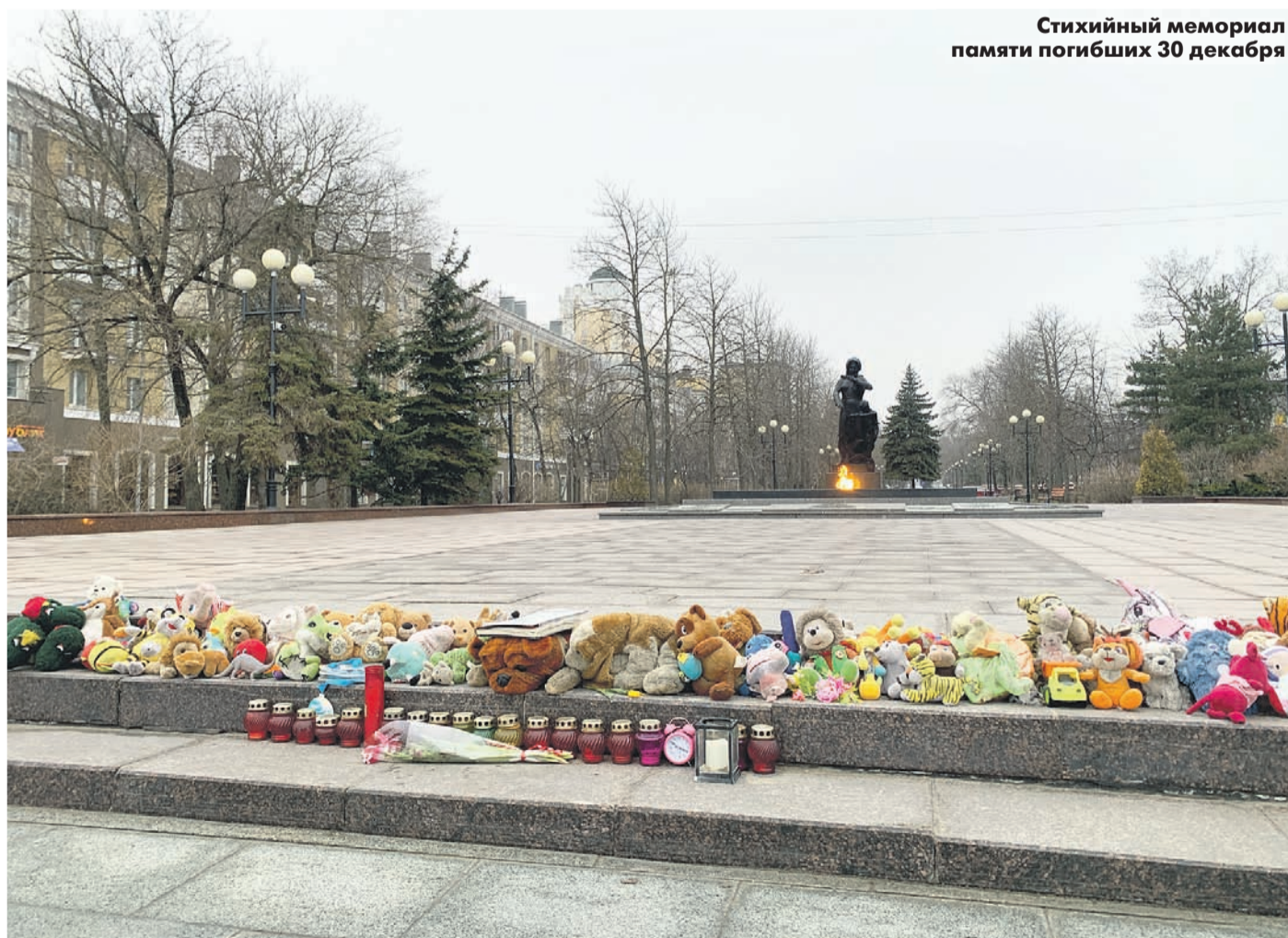
Стихийный мемориал памяти погибших 30 декабря

Чиновников такие аномалии совсем не смущают, и по итогам второго дня голосования губернатор Гладков заявил уже о 77-процентной явке: «Наверное, враги наши забыли, что чем сильнее давление на русского человека, тем сильнее сопротивление, отдача. <...> Белгородская область — пример для всей страны».