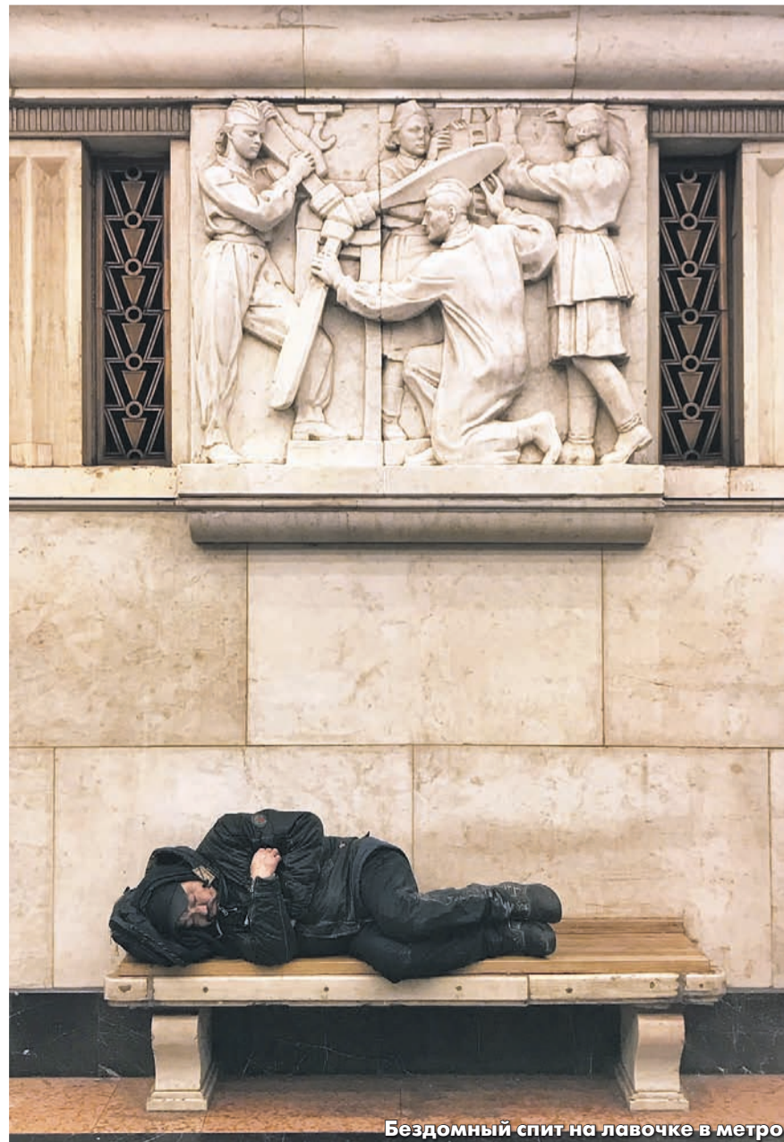
Бездомный спит на лавочке в метро

1 сентября 2023 года Минтранс запретил находиться на вокзалах и в электричках людям «в пачкающей одежде, имеющей зловонный запах, которая может загрязнить вагон и вещи других пассажиров». В «Ночлежке» полагают, что эта мера осложнит жизнь бездомным, поскольку для них вокзалы — одно из немногих мест, где они могут переночевать.