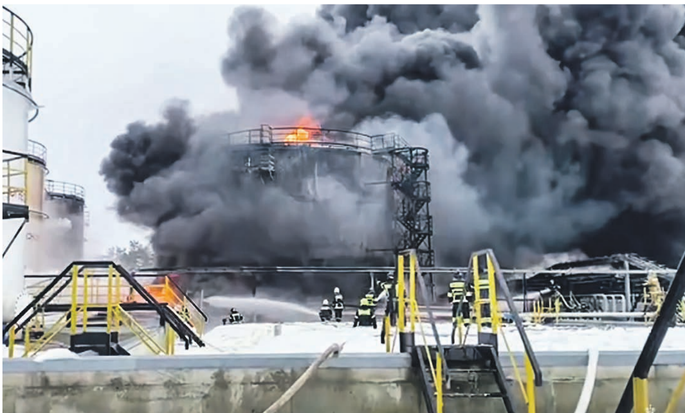
Сотрудники МЧС России во время ликвидации пожара на Клинцовской нефтебазе