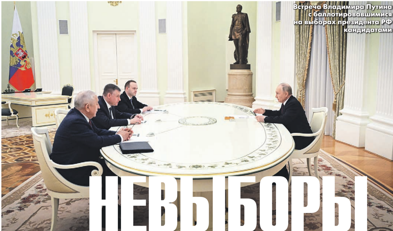
Встреча Владимира Путина с баллотировавшимися на выборах президента РФ кандидатами